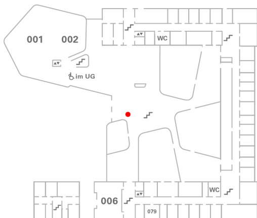
ZF Campus der ZU | EG